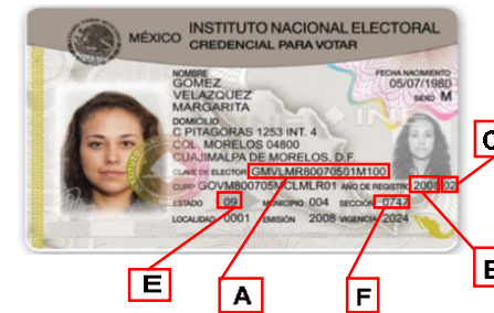
ANVERSO DE LA CREDENCIAL